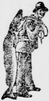
Az Emulsió vásárlásánál a SCOTT-féle módosított védjegyét — a halast — kérjük figyelembe venni.

a SCOTT-féle Emulsió hatása minden alkalommal, ha azt angolkórban szenvedő gyermeküknek adják. A SCOTT-féle Emulsió feltűnő gyorsan gyógyítja és izmosítja a gyermekeket erősíti a csontokat