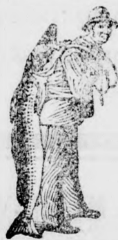
Az Emulsió vásárlásánál a SCOTT-féle módszer védjegyét — a halászt — kérjük figyelembe venni.

eszer használata által. A gyermekeknek étkezdvet kölcsönöz. Ha betegeskedik a gyermek, úgy azonnal adjanak neki