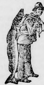
Az Emulsió vásárlásánál a SCOTT-féle módszer védjegyét — a halászt — kérjük figyelembe venni.

a mely nem bírja el a közönséges csukamájolajat, a