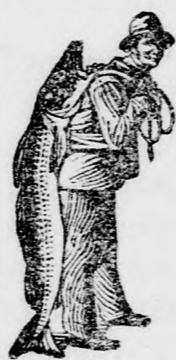
Az Emulsió vásárlásánál a SCOTT-féle módszer végigjegyet — a halászt — körik figyelembe venni.

egyaránt hatásos fiatalnak és öregnek. A gyors javulás meglep és kielégít.