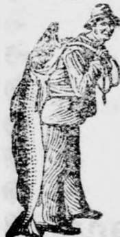
Az Emulsió vásárlásánál a SCOTT-féle módszer védjegyét — a halászt — kérjük figyelembe venni.

hatása alatt rohamosan javul és az angolkóros gyermekek époly rózsás és viruló arcszint kapnak, mint az egészségesek. Az orvosok állandóan ajánlják a