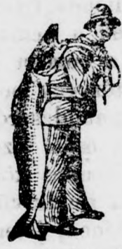
Az Emulsio vásárlásánál a SCOTT-féle módszer védjegyét — a halászt — kérjük figyelembe venni.

s a csecesemő rózsásabbá, vidámbábbá és pajzánabbá válik, mint valaha volt.