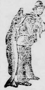
Az Emulsió vásárlásánál a SCOTT-féle módszer védjegyét — a halászt — kérjük figyelembe venni.

Ugyan adjatok a szenvedőnek SCOTT-féle Emulsiót és kiméjétek meg álmatlan éjszakától. A fogak minden fájdalom és bélbaj nélkül bujnak elő, fehérek, erősek és egyenesek lesznek.