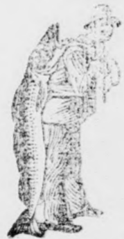
Az Emulsió vásárlásánál a SCOTT-féle módszer védjegyét — a halászt — kérjük figyelmebe venni.

olyan édes mint a tejszín és a beteg szívesen veszi be és megemészteti még akkor is, ha a tejet visszautasítja. Köztudomású, hogy az orvosok az egész világon legmelegebben ajánlják a