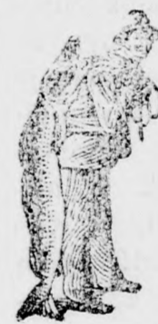
Az Emulsió vásárlásánál a SCOTT-féle módszer védjegyét — a halászt — kérjük figyelembe venni.

sokkal könnyebb már az első néhány adag SCOTT-féle Emulsió után is és ez a megkönnyebülés napról napra növekedik.