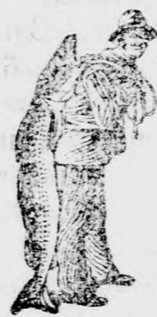
Az Emulsió vásárlásánál a SCOTT-féle módszer védjegyét — a halászt — kérjük figyelembe venni.

egyaránt hatásos fiatalnak és öregnek. A gyors javulás meglep és kielégít.