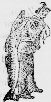
Az Emulsió vásárlásánál a SCOTT-féle módszer védjegyét — a halászt — kérjük figyelembe venni.

Ama kiváló és koncentrált táplálék, a mely a SCOTT-féle Emulsió-ban foglaltatik, táplálja a csontokat s azokat keményekké és egyenesebbé teszi. E szer hatása alatt a csontokat körülvevő hus egészséges és szilárd lesz.