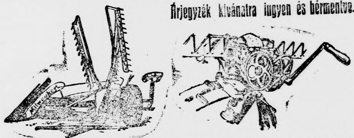
Írjegyzék kívánatra ingyen és bérmentve.

melyek az egész világon és újabban a magyar gazdaságokban is mint a legjobbak vannak elismervé.