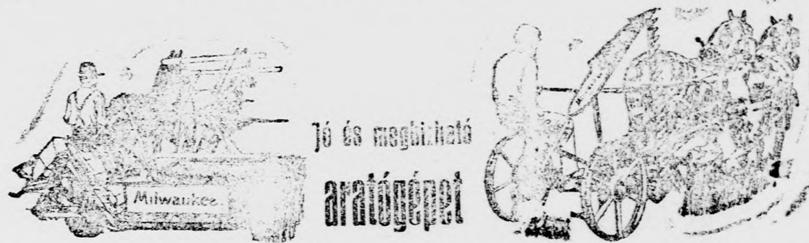
Jó és megbízható aratógépek

szivesen vásárol a gazda, mert azzal időt és pénzt takarít meg.