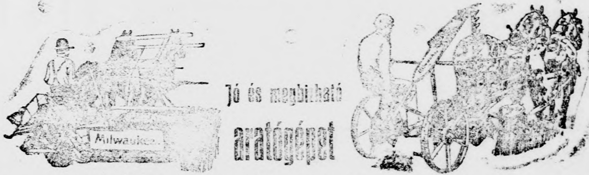
Jó és megbízható aratógépet

szívesen vásárol a gazda, mert azzal időt és pénzt takarít meg.