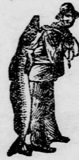
Az Emulsió vásárlásánál a SCOTT-féle módszer védelme — a halászt — kérjük ágyalombba venni.