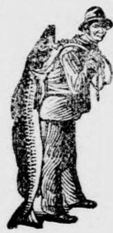
Az Emulsió vásárlásánál a SCOTT-féle módszer védjegyét — a halászt — kérjük ügyfelemben venni.

által. Néhány kevés adag teljes megelégedésére fogja ezt Önnek is bebizonyítani.