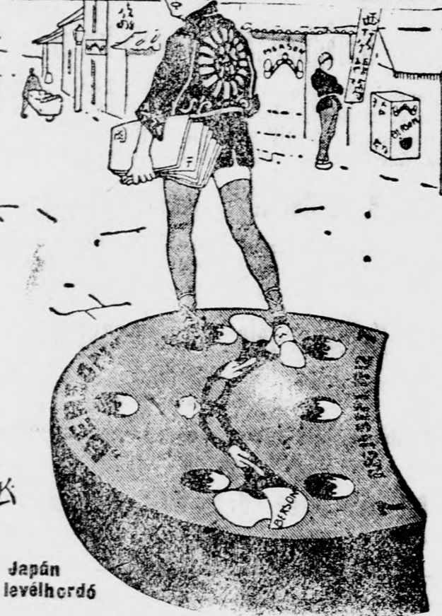
Ferdére taposás, kisiklás, fáradtság, az idegek rázkódtatása kizárva! Bersonművek Budapest, VII.

azonnal felismerte az új gummisarok számos előnyeit!