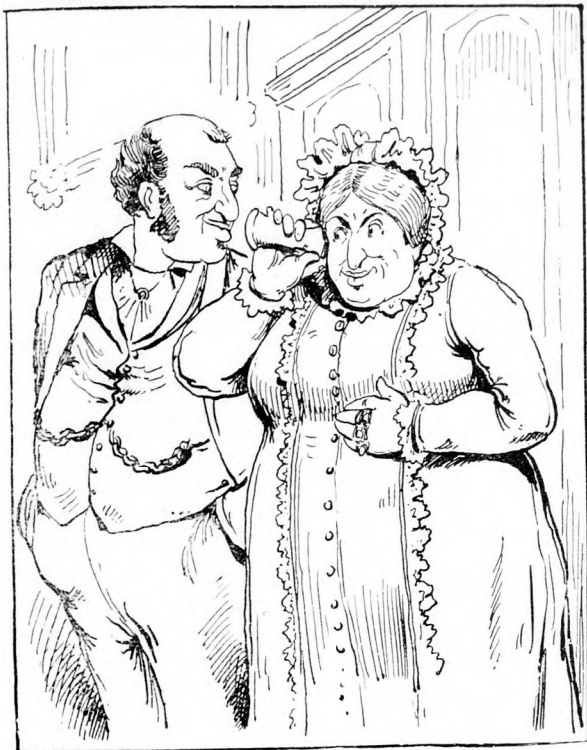
„Blumenfeld sein Sohn ist in den Ehestand getreten.“ „In was ist er getreten?“