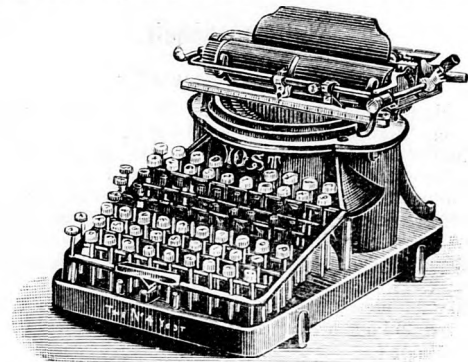
Yost's beste amer. Schreibmaschine.

Im Vereine mit dem Landes-Stenographen-Verein errichteten wir eine Maschinen-Schreibschule , in welcher wir das nötige Personal ausbilden lassen, um gleichzeitig mit der Schreibmaschine den fertigen Schreiber empfehlen zu können, der im Stande ist, nach einem als Dictat aufgenommenen Stenogramm die Correspondenz auf der Schreibmaschine zu verrichten.