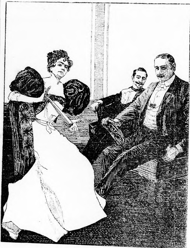
Eine kleine Humoreske.

Man sprach von dem der Männerwelt häufig verhassten, der Damenwelt jedoch unentbehrlichen Mieder. Doctor Hollunder durfte als Arzt schon eher darüber seine Meinung sagen, als sein jüngerer Freund Hugo, der während des Gespräches überlegen lächelte. Indess, Frau von Breitenstein war geistreich und klug genug, um alle Bedenken, die der Arzt aussprach, logisch zu widerlegen: