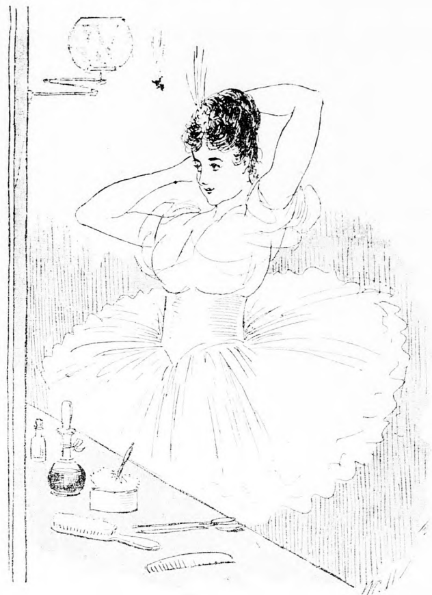
Ein Mädchen fin de siècle.

„Eine geniale Idee! Was sind sämtliche Erfindungen und Neuerungen, welche die Jetztzeit hervorgebracht, zu derjenigen, die sich Graf Muki jetzt nutzbar macht! Nutzbar für sich, wie auch für mich. Jawohl, diese Budapesti Visszatérítési Pénztár, Kossuth Lajos-utca 19, ist schon die grossartigste Erfindung, die man sich denken kann. Was sind die Liebesopfer meines früheren Baron Arthur, was die feinsten Parfümerien von Lux Mihály, die schönsten Brillanten von Bártos Lajos és Társa, die verführerischsten Seidenstoffe von Szénássy és Hoffmann, die reizendsten Linnen von Kunz József és Társa und die niedlichsten Schuhe von Kajári Dezső im Vergleiche zu den Restitutions-Coupons der Visszatérítési Pénztár.“ (Nochmals in den Spiegel blickend): „Nun, ich bin ja im Grunde genommen hübsch genug, dass mir Graf Muki die kleinen Geschenke bei diesen Firmen ebenfalls kaufen wird, aber — die Restitutions-Coupons, die bleiben in jedem Falle der Traum meiner Wünsche und der Preis meiner Liebe!“