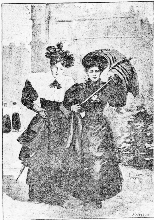
Des Zufalls Launen.