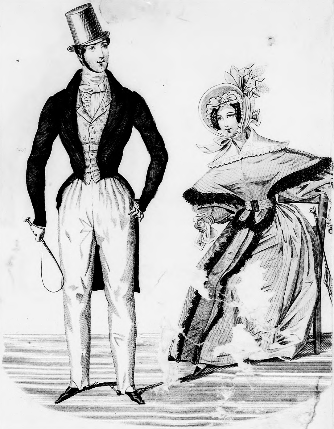
Modebild 20. Spiegel.