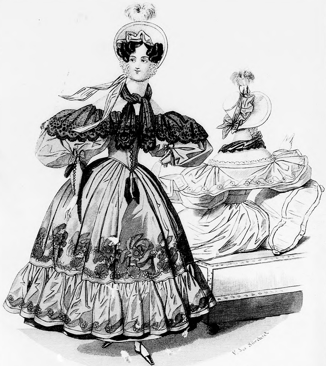
Modembild zu Spiegel.