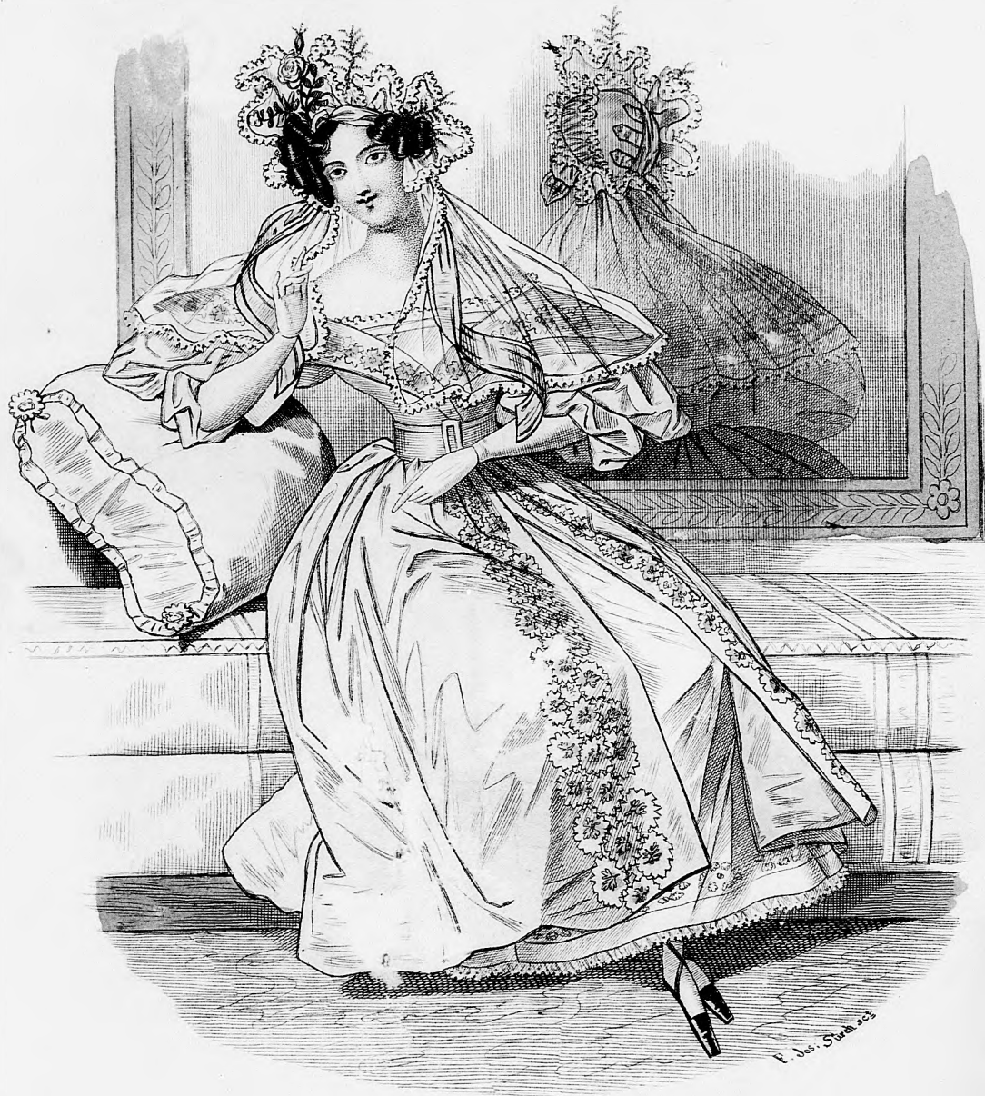
Modenbild z. Spiegel.