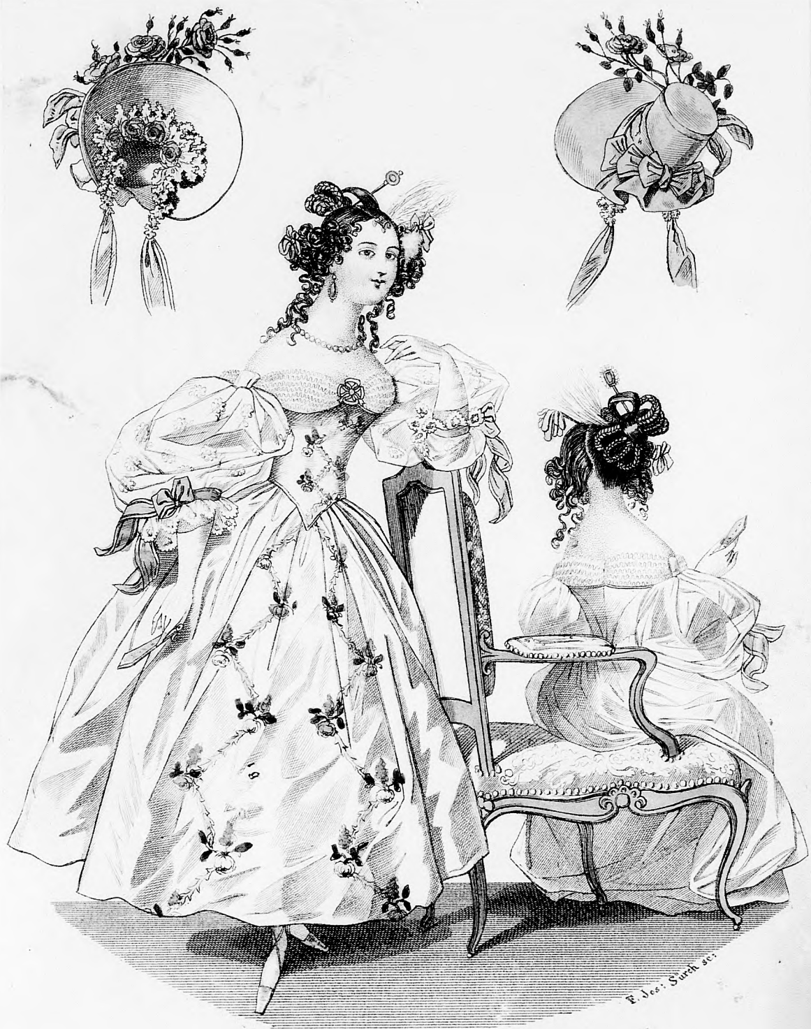
Modebild z. Spiegel.