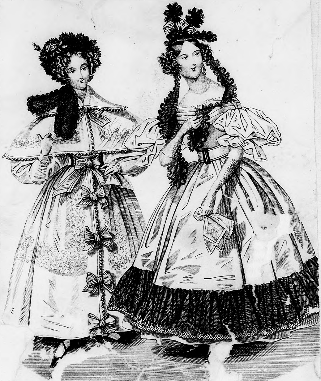
Modebild z. Spiegel.

haben und nützlich verbreiten, und die machen. Nicht nur, Franzosen „Magasin ziehendes enthalten, en Gewande wieder Verstande im Ein- nützigen Wissens ge- agazin“ vereinigt arische Unternehmen en (Baiznergasse, ö nigreich Un- in“ übernommen, — aus 52 gro- Medianbögen rlin gefertige rei fl. C. M. ist. and es jedem Leser schaffen, das bereits dürfte sich leicht auf welches ebenfalls angenommen wird, urnal gemeins Paris in deutscher blt. Man findet in weisung, seine büs- ten kennen zu ler- Schrift ist wie der