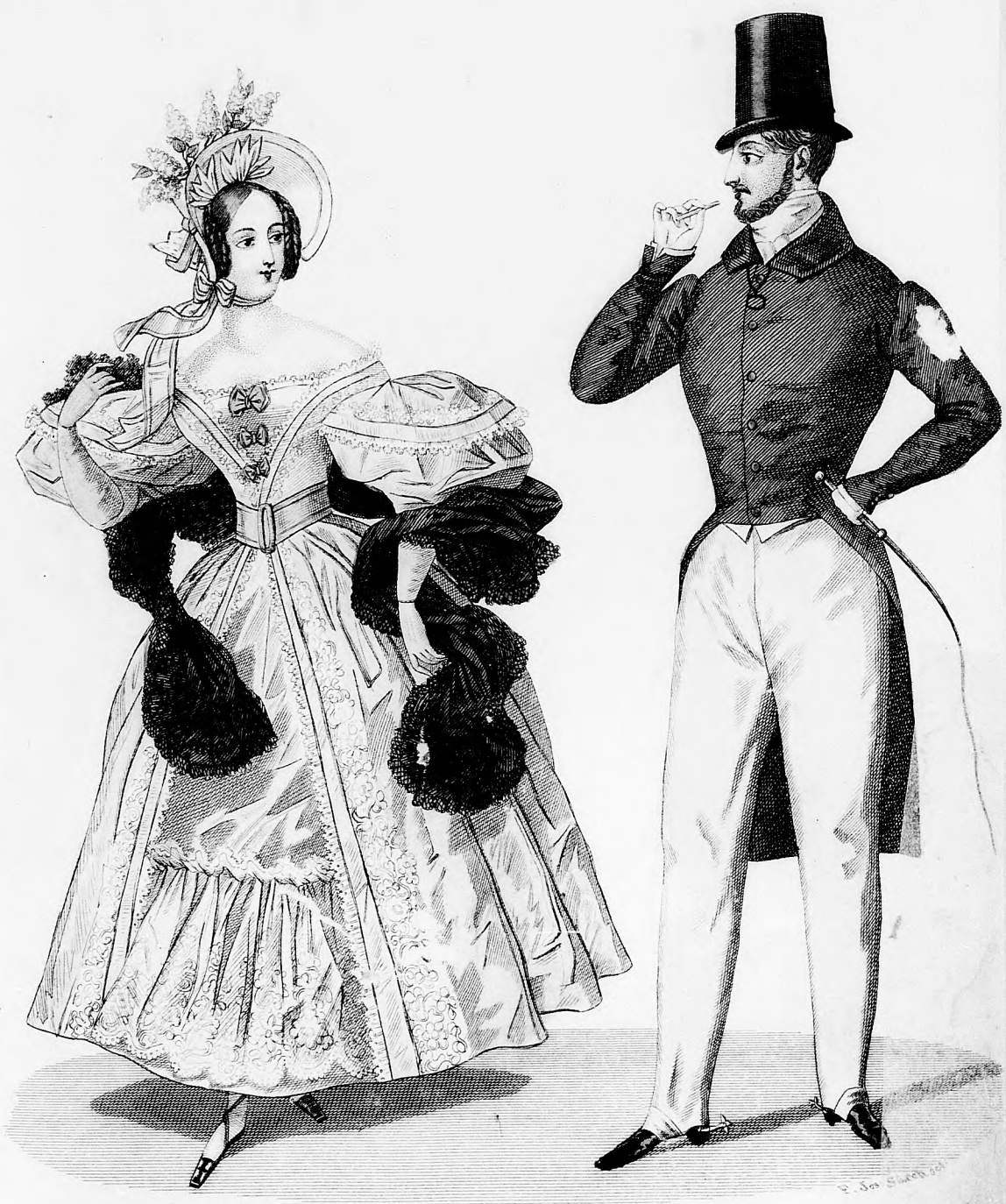
Modebild. d. Spiegel.