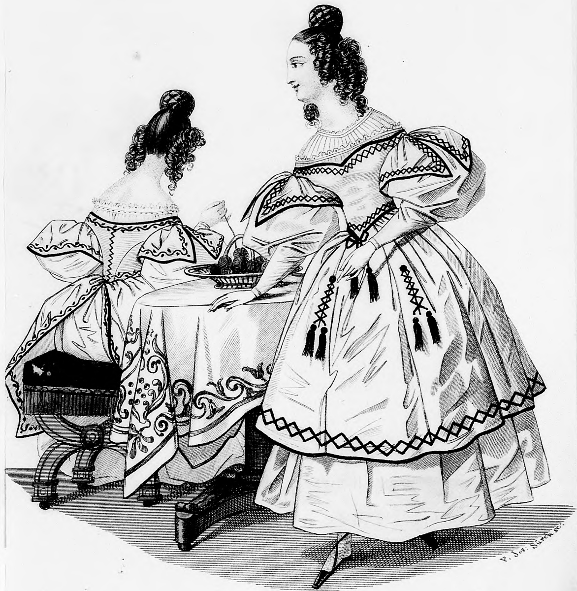
Modebild zu Spiegel.

... März. Koef- ...hen abermals auf ...liefern, aufmerk- ...e von Paris nach ...t und ausgegeben ...eilfertigkeit auf- ... Wiesen.