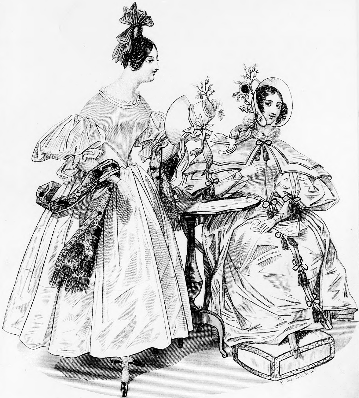
Modellbild 22. Spiegel.