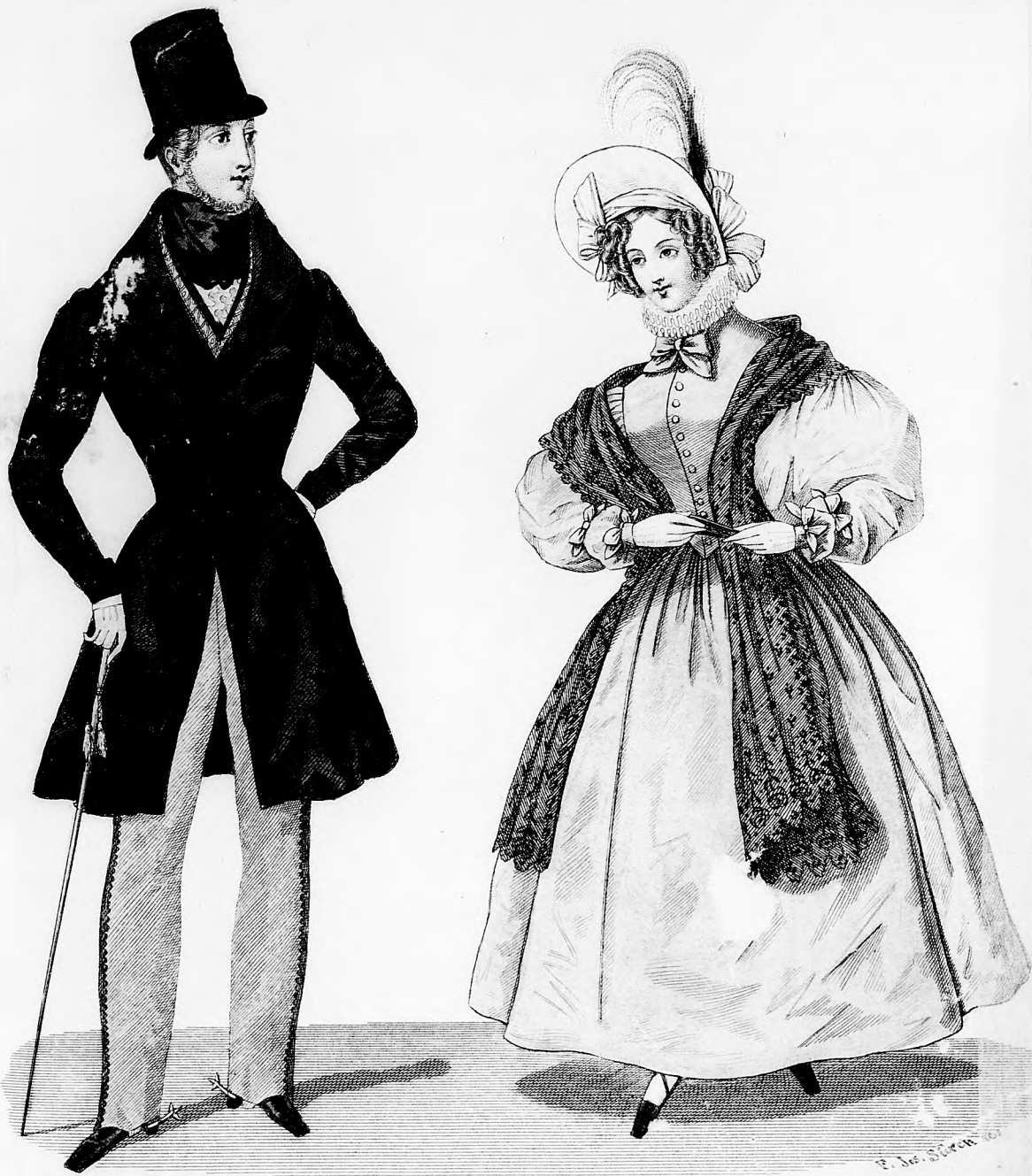
Modebild z. Spiegel.