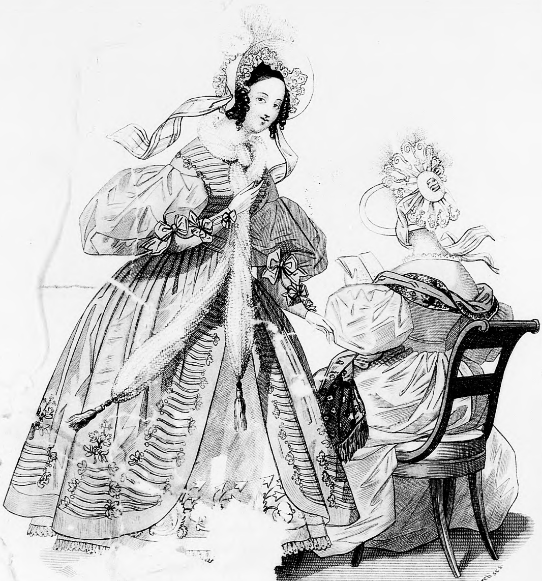
Modembild z. Spiegel.