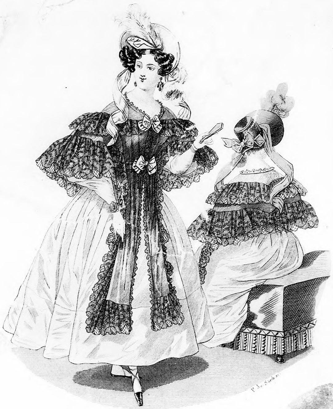
Modembild & Spiegel.