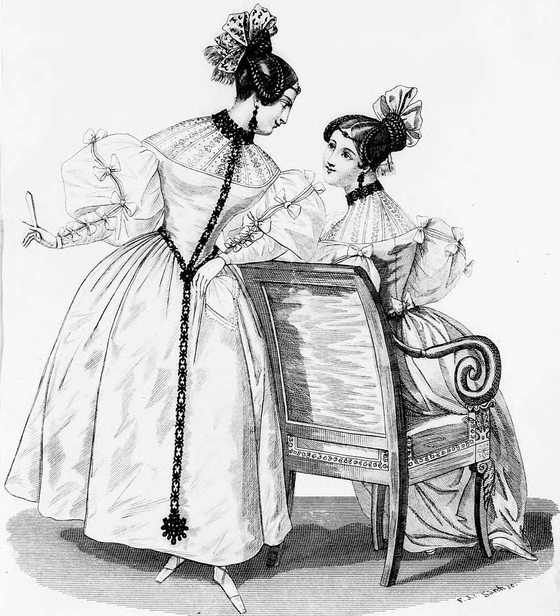
Modebild z. Spiegel.