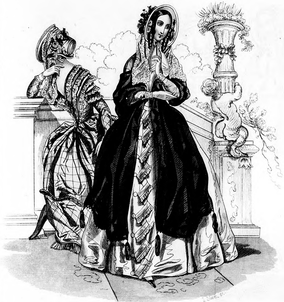
Modes de Paris. Le Miroir.

eschicht heitere e stüt- n einer Haupt- n Wei- Grill, Werd, Sdr. Peter- stipiele hören tendem ie tech- en An- n Fin- erul im halten- „Kar- ekann- de. e neue stiens i. Wie m t e Se- dürfte sein, , wie wür. a Herr Frühe: lichem e seine g sind, Blatt. weiten he als Sün- Klau- utischen heater it zur r b n. hal.