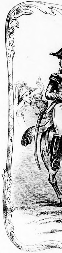
Bilder-Selbst zum Spiegel.