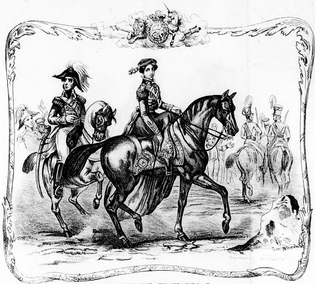
ALEXANDRINE VICTORIA I.