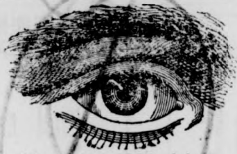
Alapított 1835. évben.

Mindenfajta fali-, zseb- és ébresztő- órák, távcsövek, hőmérők, időjelzők.