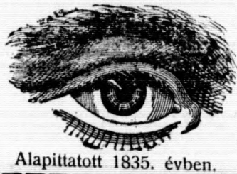
Alapított 1835. évben.

Mindenfajta fali-, zseb- és ébresztő- órák, távcsövek, hőmérők, időjelzők.