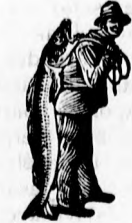
Az Emulsió vásárlásánál a SCOTT-féle módszer védjegyét — a halászt — kérjük figyelembe venni.

specifikus megbízható szer mindennemű tüdőbaj