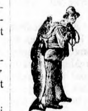
Az Emulsió vásárlásánál a SCOTT-féle módszer védjegyét — a halászt — kerjük figyelembe venni.

Egy eredeti üveg ára 2 korona 50 fillér. Kapható minden gyógyszerárban.