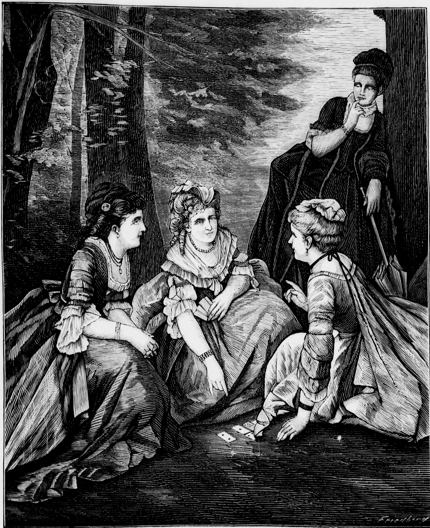
Szerelmi jós. (Szövegét lásd a 199-ik oldalon.)