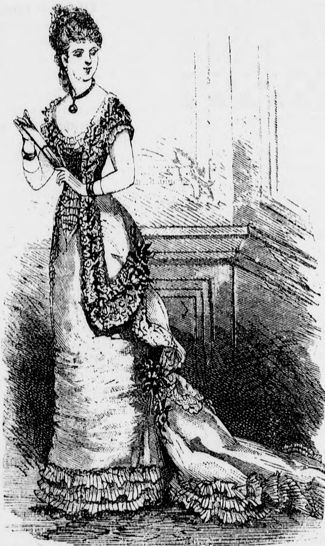
3. Bál öltözék tafota és gazeból

Egy tiz éves leányka lepke jelmezben, kezében a varázs-pálcaival; a jelmez nyári öltözékből volt összeál-