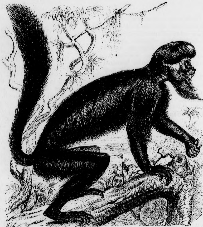
A szakállos saki. (Szövege a 71. oldalon.)

E várakozás alatt teljesen bekerítettett; az ellen, melyet diadal-utjában megállított, most egész erejével feléje fordult, a százazrek mind Plevna körül csoportosultak, hogy a hőst, ki győzelmi mámorukból kiábrándítá, rettentő erejükkel megsemmisítsék. De az erődben Ozman