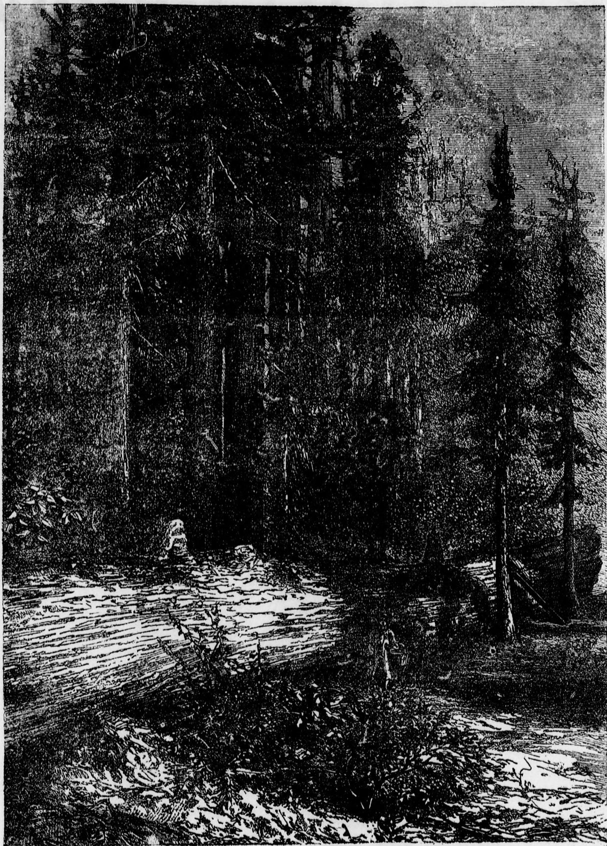
A kidólt óriás. (Szövege a 71. oldalon.)