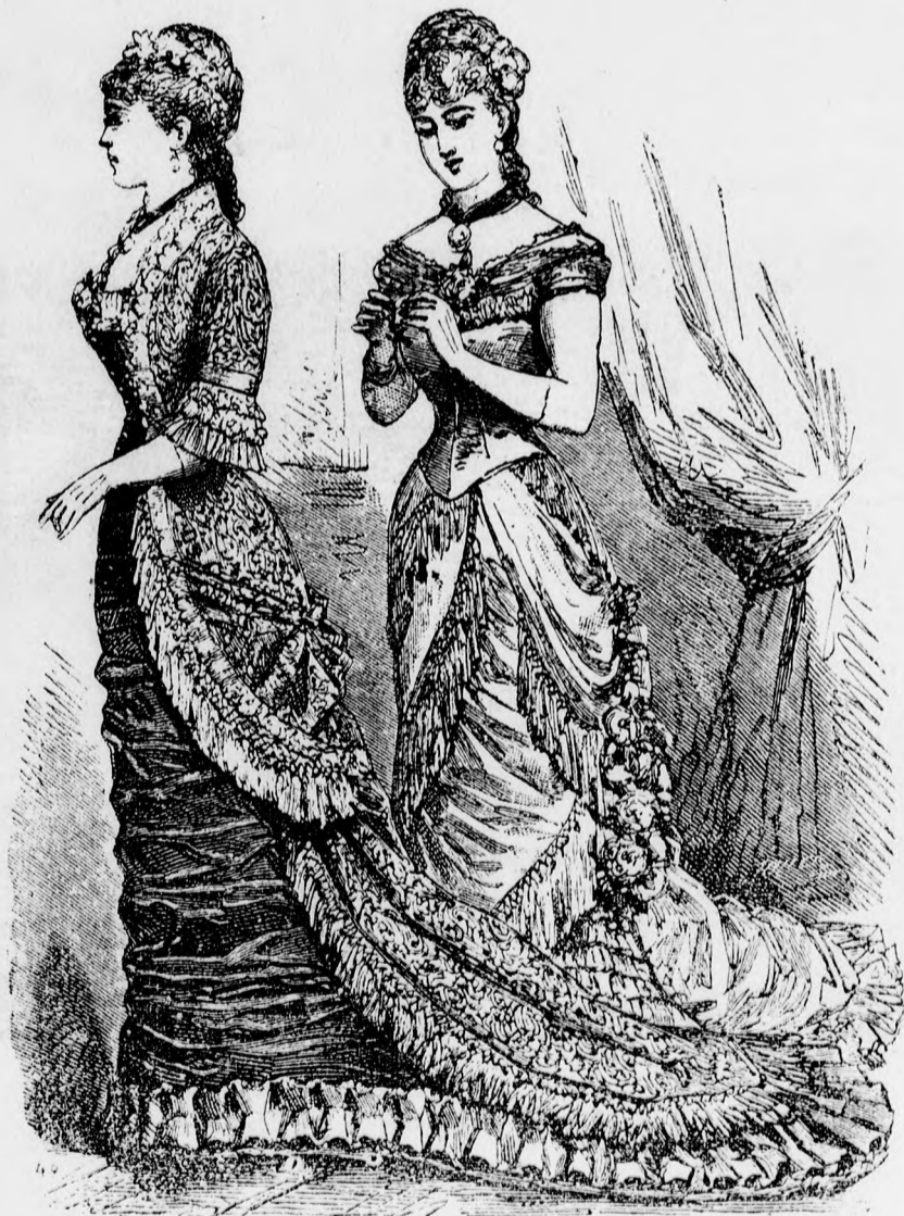
1. Ebédlő öltözék stb.

gyermek-mulatságokat rendeznek. Az ily ünnepélyek, melynek hősei a tizenötödik évet is alig érték el, csupa vidámságból s örömből, kacajból állnak, különösen a kis emberek részéről; a kis nők bájosabbak, de jobb modoruak is lévén, nem engedik magukat elragad-