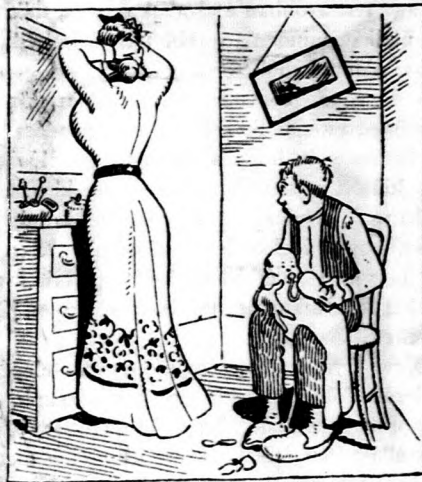
és a házasság után.