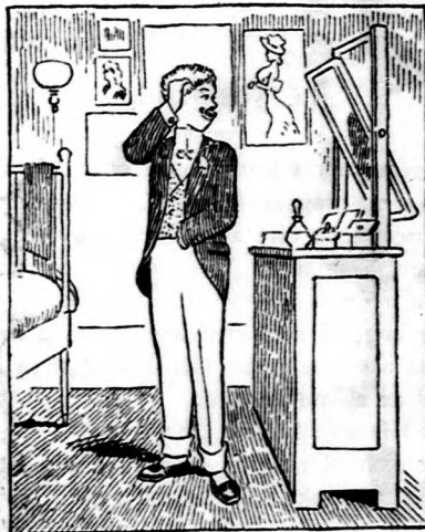
a házasság előtt