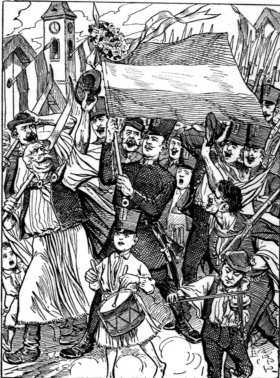
Ez lenne a legjobb felelet azokra a „hadi-parancsokra!“