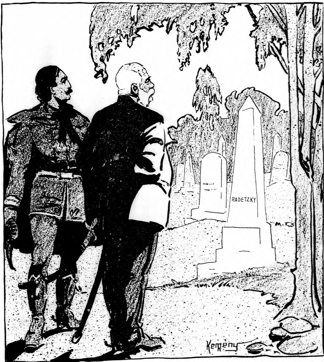
A CSÁSZÁR: Magyar vezényszó helyett adok egy temetőt.