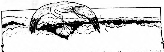
A TALIHÁNY TEMPLONY.