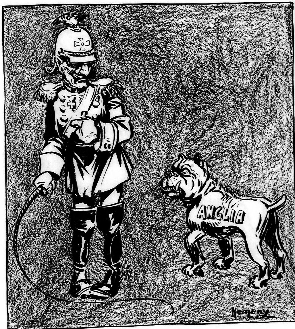
Vilmos császár: Megütném ezt a kutyát, de attól tartok, hogy megharap.