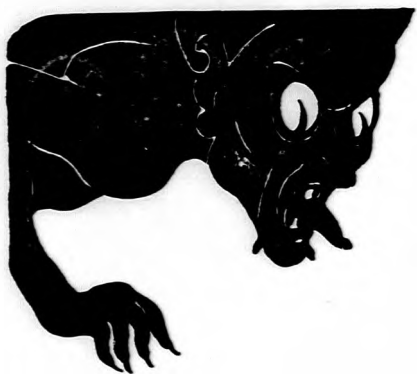
A LÁTÓ TELEFON.

A minap két atyafi betoppant az "öreg bankár" irodájába. A szokásos "jó napot kívánok, hogy tetszik lenni" bevezetés után mondja az egyik: