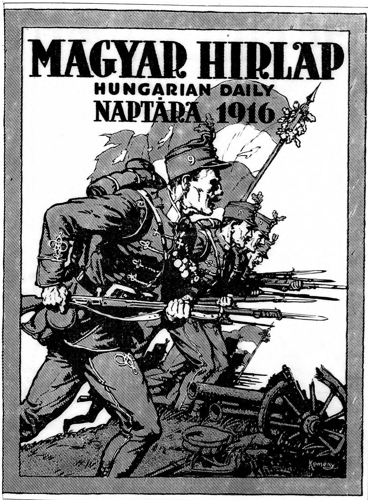
A Magyar Hirlap jövő évi naptárának címképe.