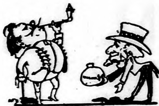
Veteránék a Karneválon.

Hát most látom, hogy néha mégis csak lyobb annak, akinnek a hátán a háza, kebelén a kenyere, mer asztat a zsványok se ütök agyon, meg azutég meg se öszül a gondtul, hogy ugyan ki lopi el a pézit. De azér néhanapján mégse ártana egy kis aprópéz, ha könnyen gyünne, mer hát nagy ur a péz, mikor van, de még nagyobb akkor, ha nincs.