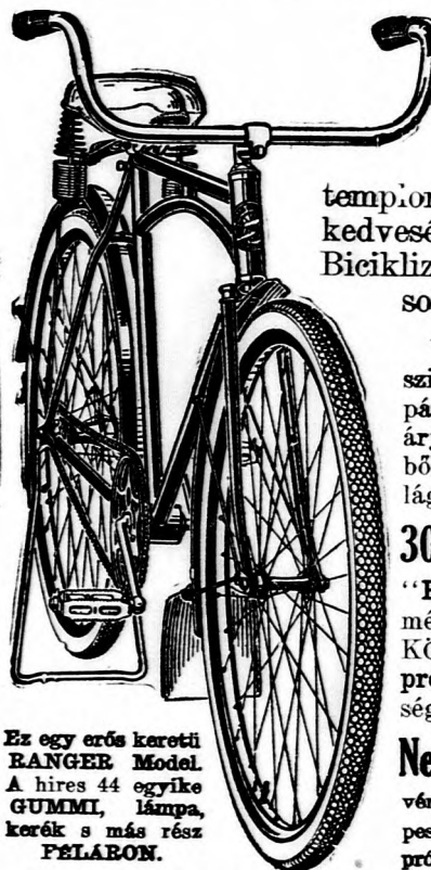
Ez egy erős keretű RANGER Model. A híres 44 egyike GUMMI, lámpa, kerék s más rész PÉLÉRON.

Bármit is hozzon a háboru. Legyen háboru vagy béke szerezzen be magának egy Ranger kerékpárt és sosem fog elkésni munkájából, a tempiómból, sem pedig barátjának, kedvesének, családjának találgájáról. Biciklizzen haza munkájából, míg mások várakoznak s gyalognak.