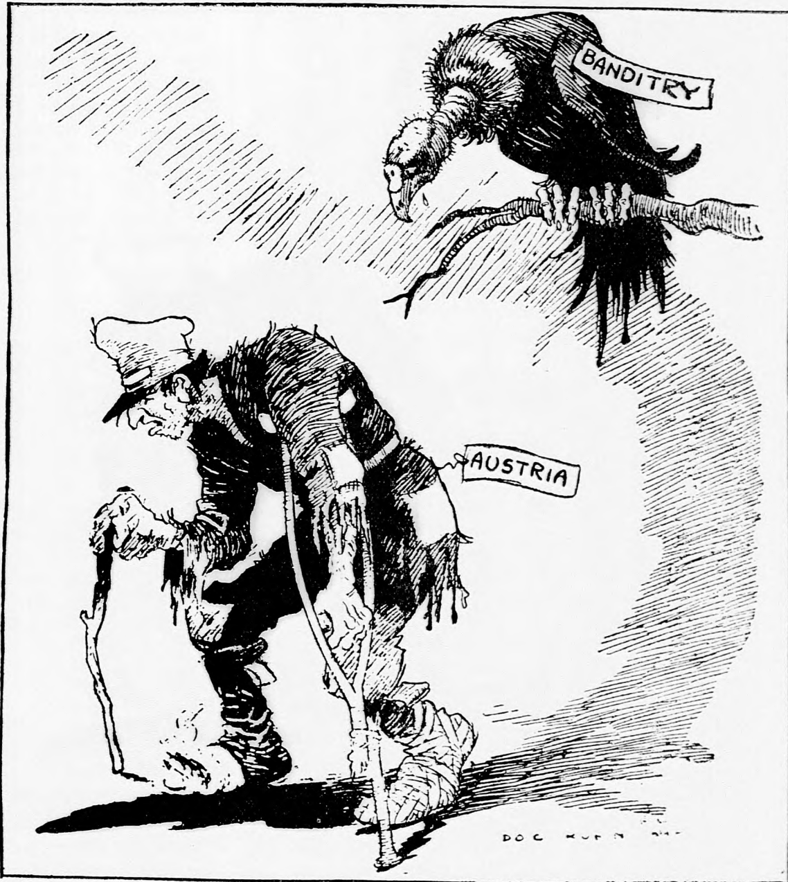
Kuhn rajza a Rocky Mountain News-ban.

ÁRA EGY ÉVRE 3 BETEG DOLLÁR AUSZTRIA ÉS A DÖGMADÁR