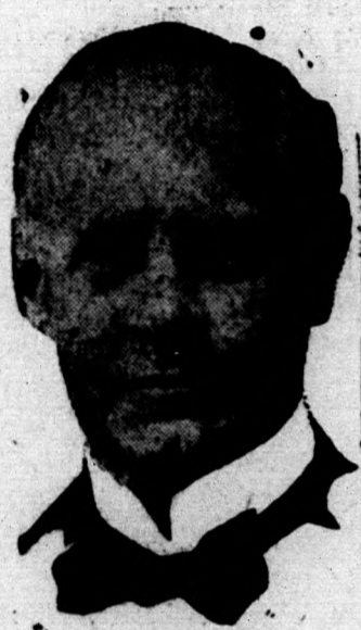
John Galsworthy, híres angol író azt a nyilatkozatot tette, hogy a világ pusztulás előtt áll, mert a tudomány legnagyobb vívmányait a háború és öldöklés szolgálatába állítja.