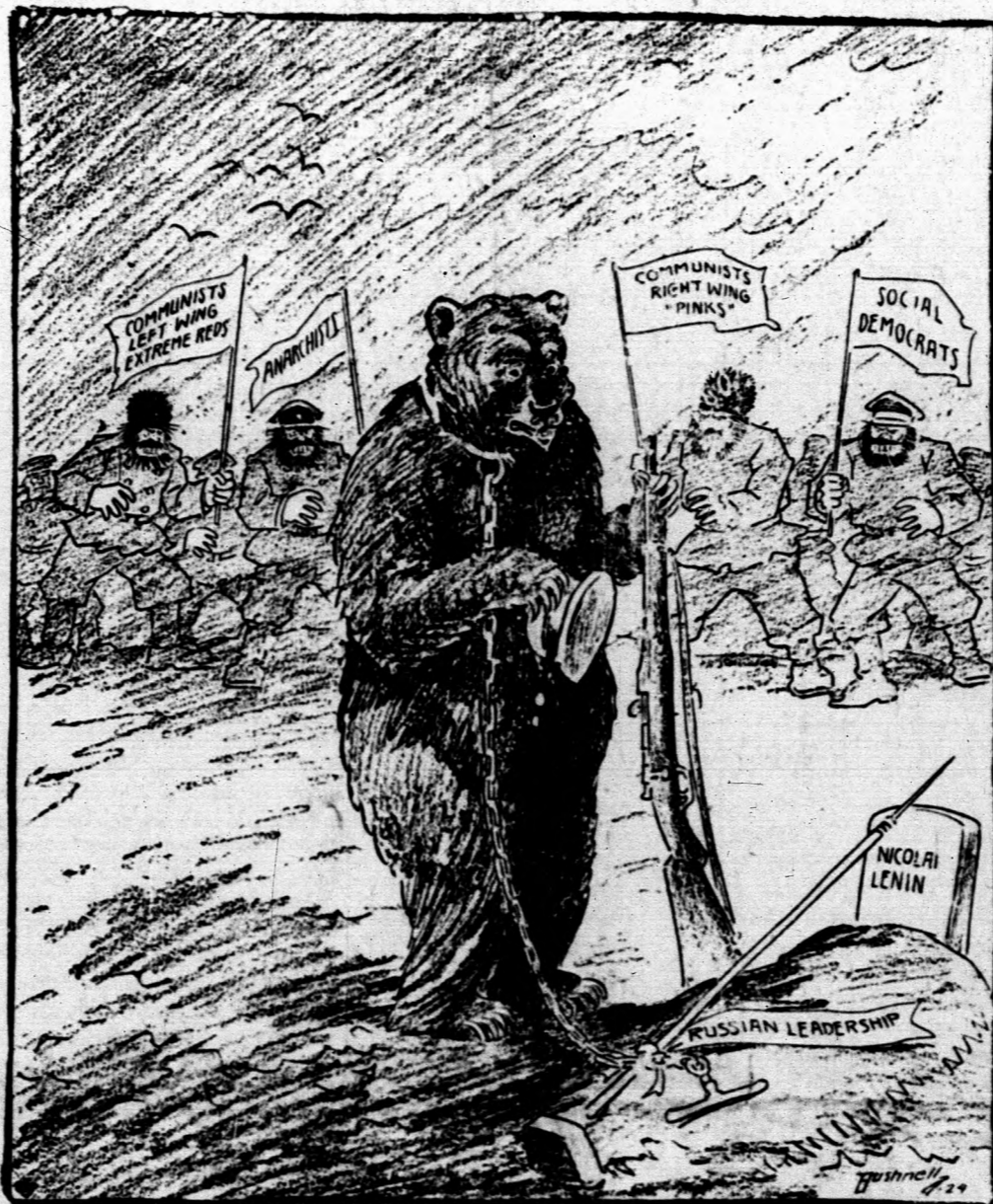
Ez most a kérdések kérdése, ki táncoltatja ezután a medvét, vagyis melyik párt ragadja az uralmat magához az óriási birodalomban? Képzünk igen találon mutatja be a hatalomért folyó harcot. Anarchis-