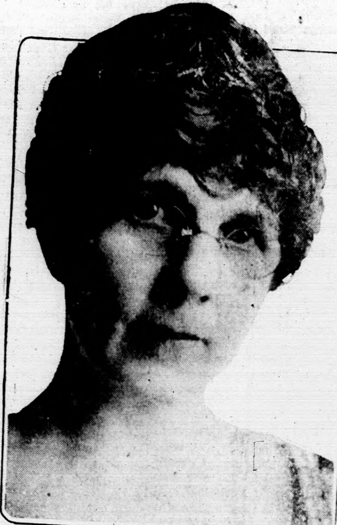
Mrs. Warren G. Harding.