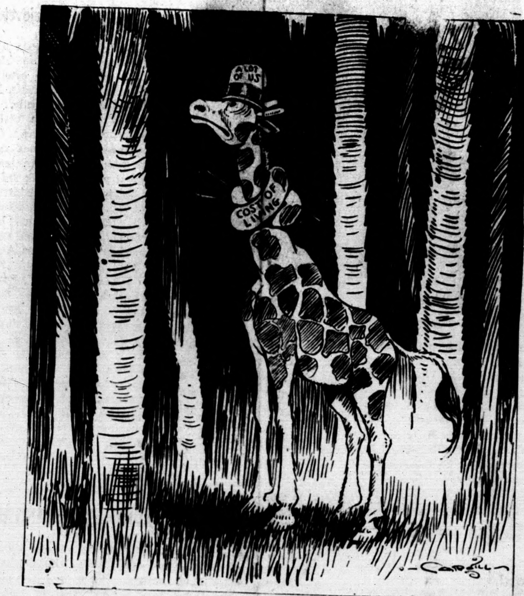
Ez a képünk az állatok világába vezet bennünket, de embereknek szóló tanulságot rejt magában. A zsiráf ez a hosszú nyakú istentemtése éhesen áll a fák alatt, amelyekről addig olyan vígan eszegette a zöld leveleket. Most azonban meg van akadva: valahogy nem éri el a fák ágait. Rajón maga is a baj okára: valami rosszakarója tudtán kívül csomót kötött a hosszú nyakára. A kép nekünk szóló tanulsága így hangzik: a szegény ember is ott áll a megélhetés minden jóval megrakott fák alatt, de nem képes legelni a zöld leveleket, mert a folyton emelkedő árak csomót kötöttek a nyakára. A drágaság folyton növekszik és a szegény csehs zsiráf nyakára egyre több csomó kerül.

A skót katonák tudvalevőleg holmi bokorugró kis szoknyáikat viselnek, ami térden jóval felül ér. Az angolhadsergeknek még a háborúból nagyon sok ilyen szoknyája maradt, de most baj van velük, mert ezek a szoknyák túlságosan rövidiek az új katonáknak. Hivatalosan azt mondják ugyan, hogy a regnuták általában véve sokkal hosszabbak, mint máskor, a szoknyák rövidségének igazi oka alicanában a háborús hadseregszállító, aki annál több hasznát csinált, minél rövidebb szoknyákat szállított a katonáknak.