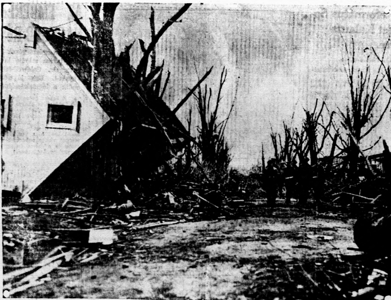
Sokkal súlyosabb feladat vár Indiana, Ill. és környéke szelvésszel sújtott népére, mint a gránáttal háború alatt elpusztított belga és francia földrészekre. Távrolról jönnek önként jelentkeztek, hogy a szerencsétleneknek segítsenek a számanekül halott eltakarításában s a mentésben. Képünk egy mentőosztagot mutat be Griffin, Ind.-ban.