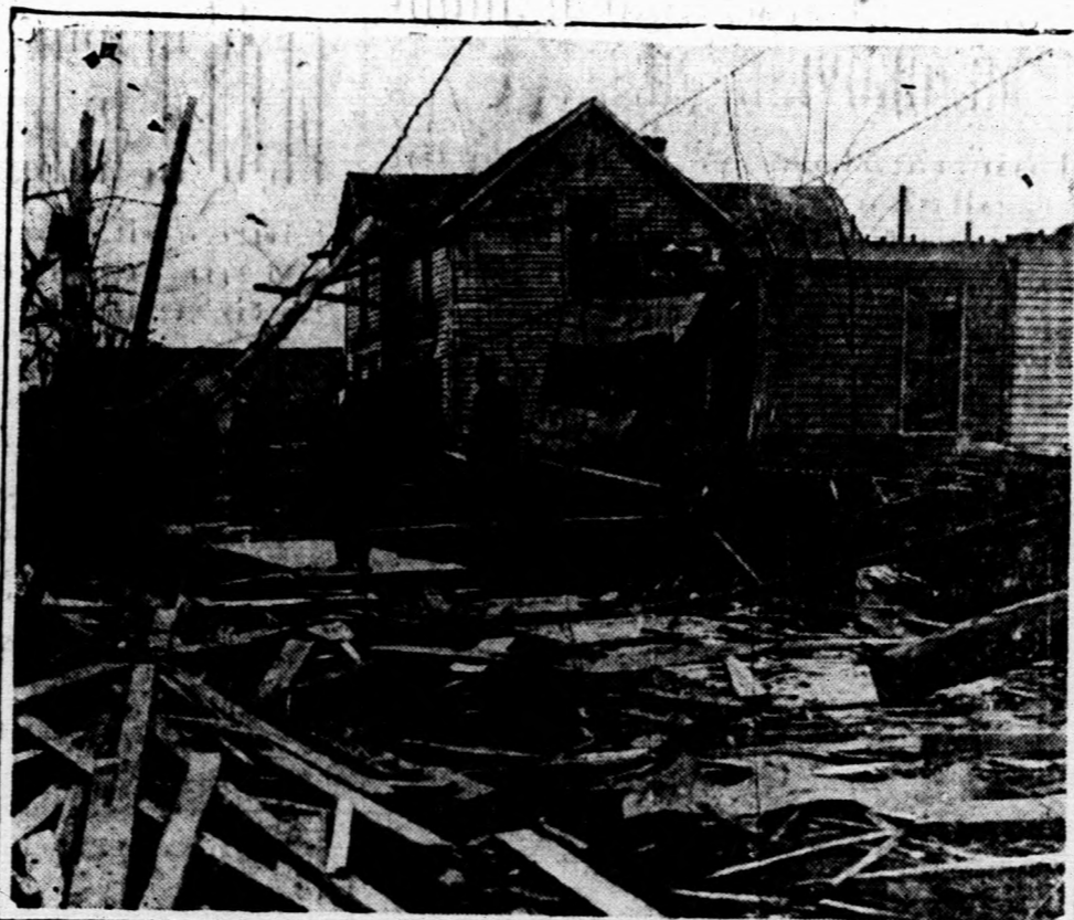
Csoda-e, hogy a szélvisszel sujtott Illinois állam és környéke nem tud a külvilággal közlekedni, mikor minden villanydrót madzagként széjjel tépve hever? Képünk Princeton, Ind. ábrázolja.

TÁRKÁNYI BÉLA 4808 Second Ave., Pittsburgh, Pa.