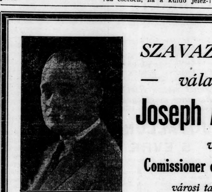
A MUNKÁSOK BARÁTJA

A jéghegynek ily módon való összezuása a rendes körülményeknél néhány nappal hamarabb távolította el a veszélyt a gyorsjárata hajók útjából.