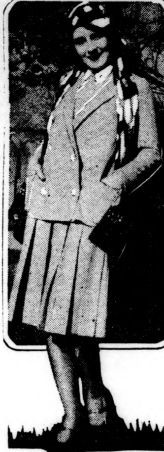
Ez a előző év sál, futurista díszítésekkel, cigánylázas külsőt ad a tulajdonosának