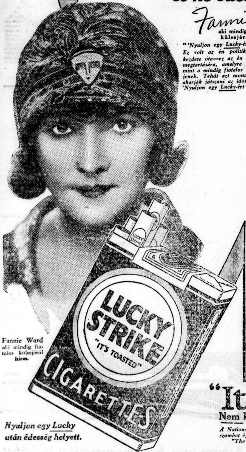
Fannie Ward aki mindig fiatal külsőjéről híres.