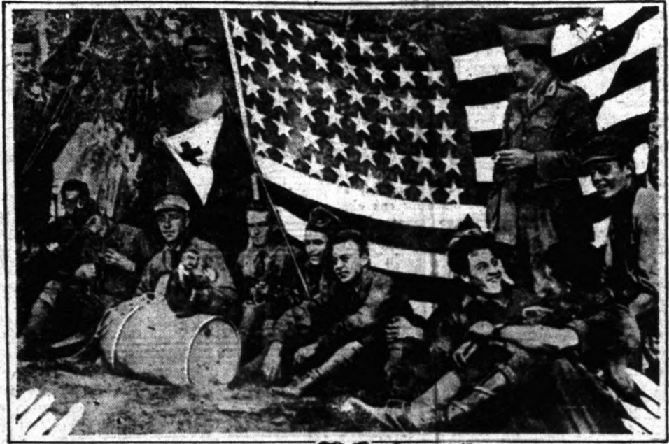
A nyugati harcmezőn Uncle Sam fiaai meglehetősen népszerűvé tették a csillagsavos lobogót. De nemcsak a csatamezőn szeretik neki dícsőrséget, hanem mindenfelé az országban, ahol csak megfordulnak.