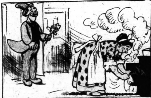
— Ah, éppen süt, főz az angyal. Azt hiszem engem vár. Mondok neki egy szép husvéti köszöntőt.