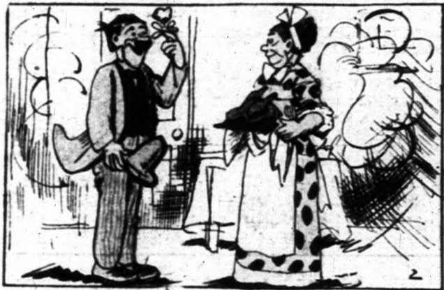
— Ez a kis ibolya elheriad, De az én szerelmem megmarad...