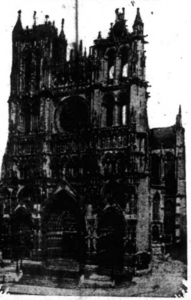
Egyike a legszebb műemlékeknek. Rendkívül nagy kár lenne érte ha a háború elpusztítaná.