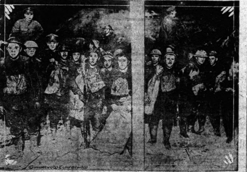
Az angol gyalogság, akit legutóbb a német hivatalos jelentés is dicserőleg említett meg vitéségek miatt, mindent elkövet, hogy a "hunnokat" kiűzze Franciaországból. A kép St. Quentin alatt készült.