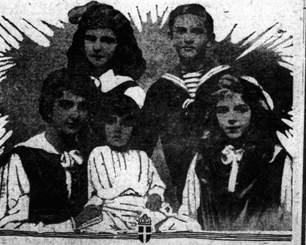
A felső sorban Mária hercegnő és Piedmont herceg, az alsó sorban Jolanda, Mafalda és Giovanna hercegnők.

— Azok az újabb véres áldozatok, amelyeket kénytelenek voltak hozni, nem voltak eredménytelenek. Tudom, hogy a birodalmi gyűlés tudja ezt és hogy állást fog foglalni az erős német béke mellett. A Frankfurter Zeitung ehhez a távirathoz a következő megjegyzést fűzi hozzá: — Bármennyi tisztelttel és elismeréssel viseltünk is a hadvezéreink iránt, úgy érezzük, hogy amikor Hindenburg beavatkozik a német politikába, ezzel csak a nagyméretű és az annexió elvét vallóknak indul a segítségére. A nagyméretű a nyugati offenzívát már amúgy is arra használják fel, hogy a birodalmi gyűlést a maguk elveinek és céljainak megnyerjék.