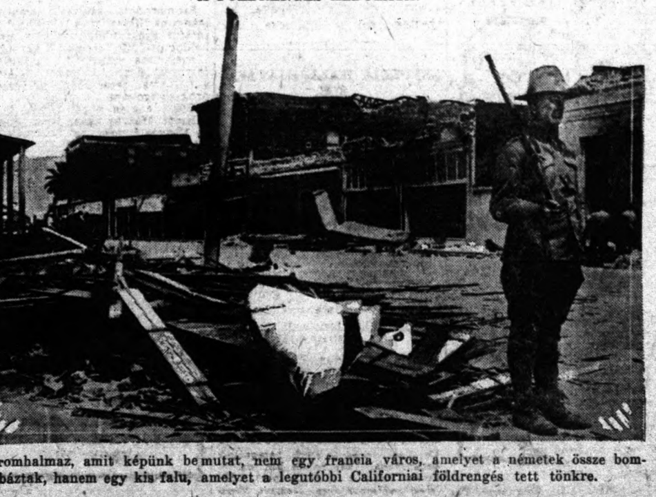
A rőmbalmaz, amit képnük be mutat, nem egy francia város, amelyet a németek össze bom...