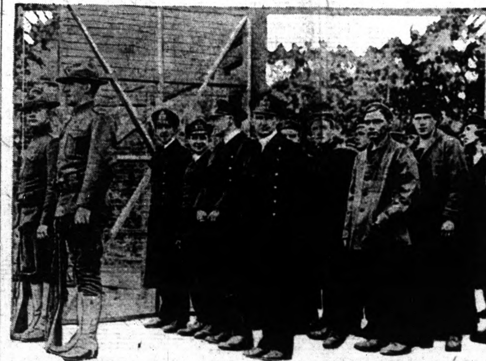
Az amerikai tengerészek által elfogott U. 58. Az első német tengeralattjáró, amelynek a legénye fogolyként Amerikába érkezik. A német legényeket Fort McPhersonba internálják.