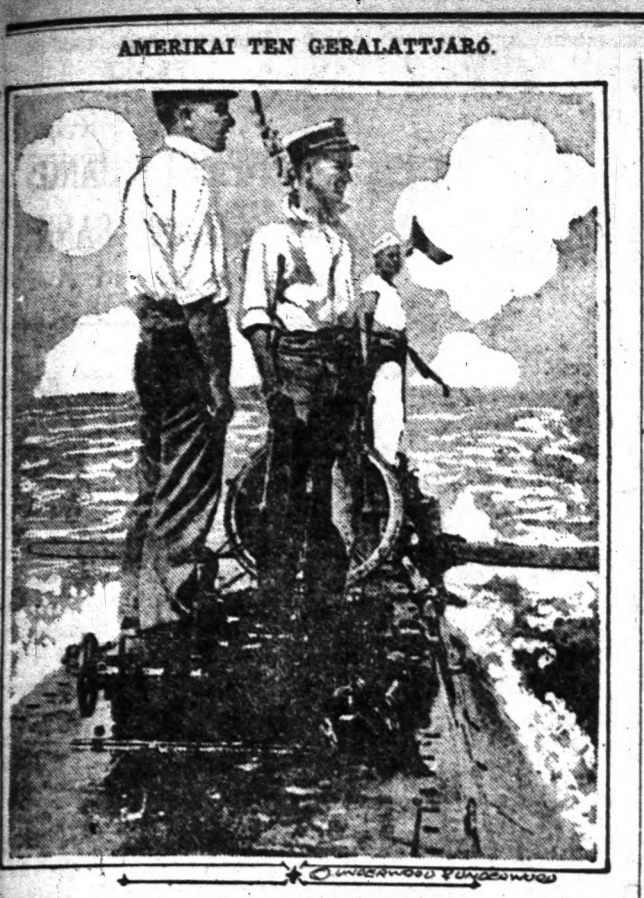
As amerikai tengerészek speciális jeleket adnak zászlóikkal és lámpákkal a tengeraltatók fedélzetéről.