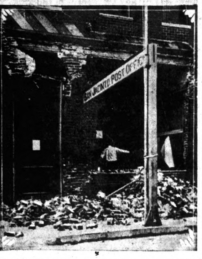
A legutóbbi földrengés, amely Californiában három napig tartott, San Jacintóban teljesen romba döntötte a postaépületet.