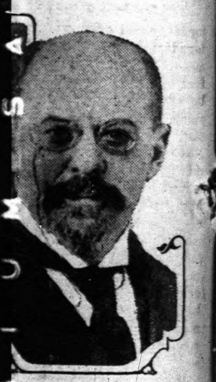
VANDERVELDE, a munició-miniszter.