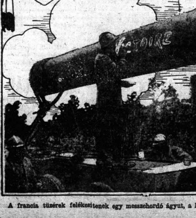
A francia tüzerek felékesítenek egy messzehordó ágyut, a háromdoruk szimbolusát.